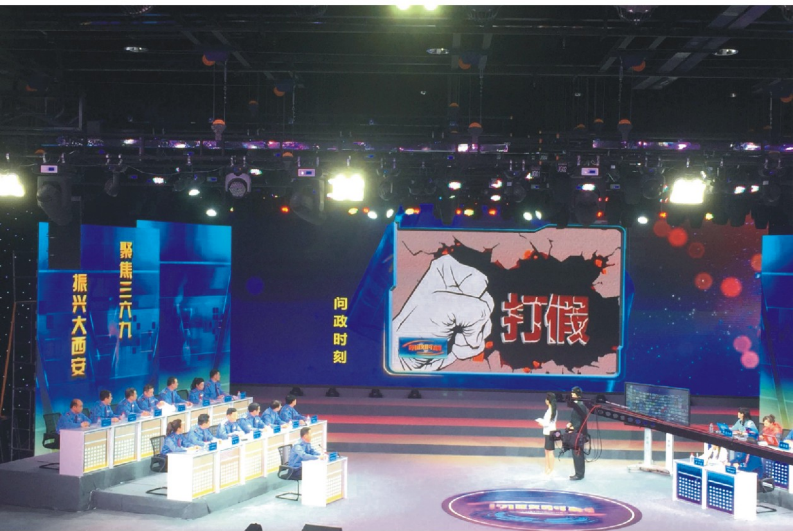
市工商局参加电视台《问政时刻》节目