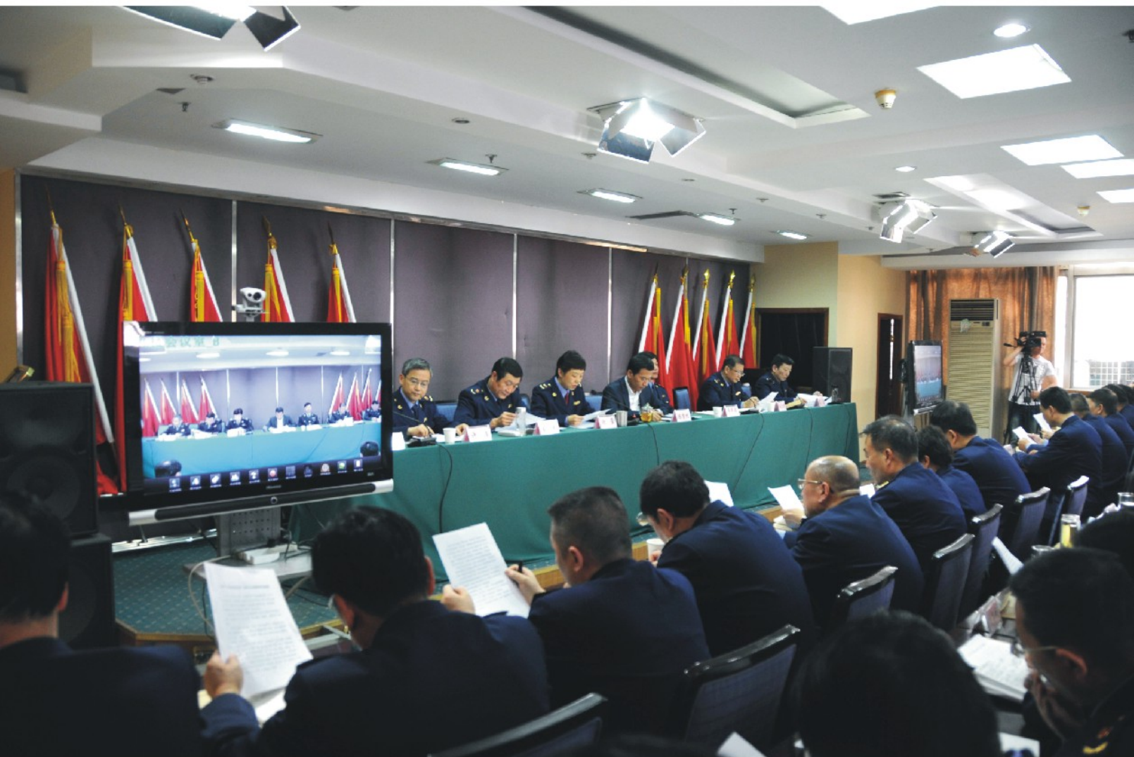
市局召开行政效能革命动员部署大会