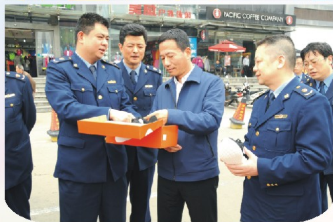
市局领导亲临一线检查督导打假执法行动