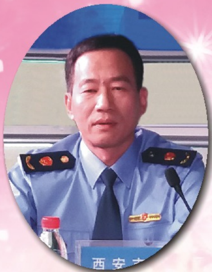
市工商局党委书记、局长陈吉利在全市行政效能革命动员大会上做表态发言

4月25日上午，全市“行政效能革命”动员部署大会召开。省委常委、市委书记王永康主持会议并讲话，市长上官吉庆讲话。大会公布了《西安市行政效能问责办法》，将对全市机关单位及工作人员不履行或者不正确履行职责，行政不作为、慢作为、乱作为等问题进行责任追究。