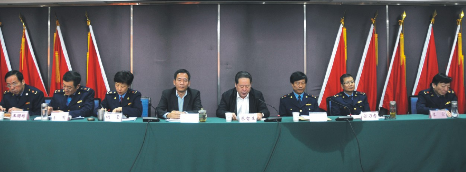
市工商局召开打假治劣专项整治行动动员部署大会